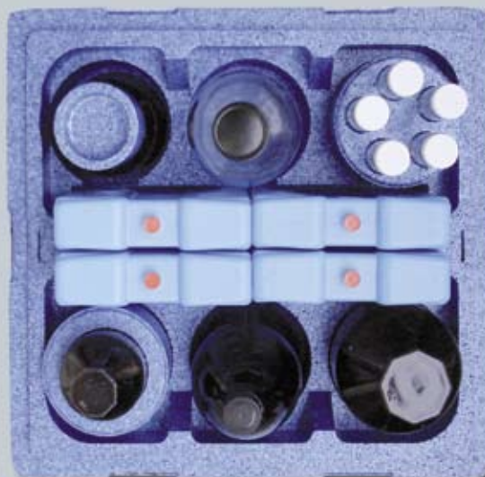
Opakowanie BOX1 wyposażone jest w pojemniki przeznaczone do przechowywania pobranych próbek wody.

Od samego początku próbki są dobrze zabezpieczone i dostarczane do naszych wysoko wyspecjalizowanych jednostek badawczych. Wyniki badań dostarczamy niezawodnie, szybko i terminowo – na życzenie wyniki udostępniamy „online”.