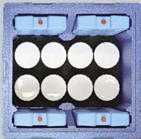
Opakowanie BOX2 wyposażone jest w pojemniki przeznaczone do przechowywania pobranych próbek gleby.